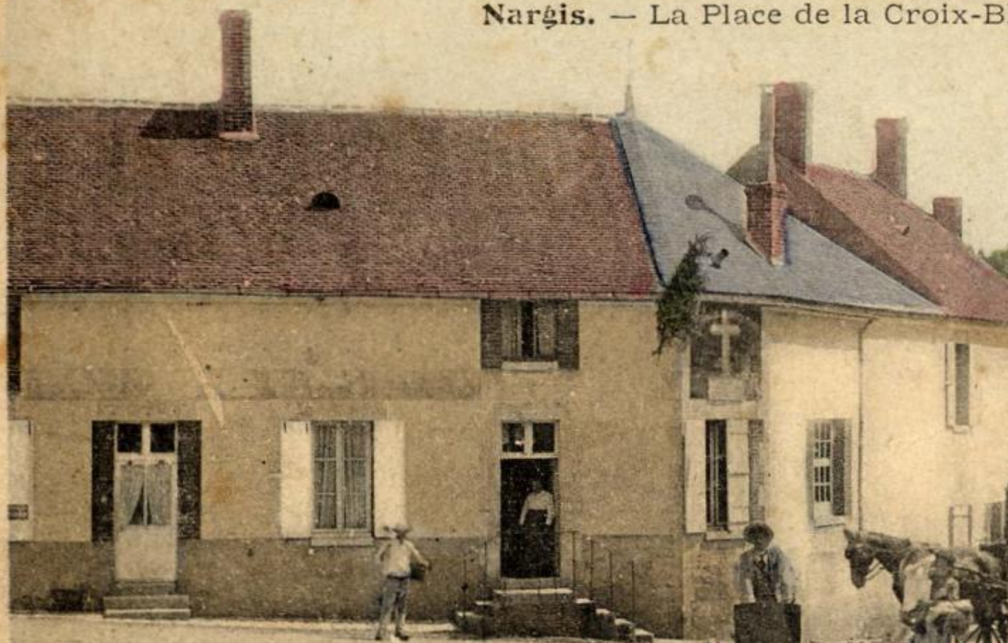
Nargis. — La Place de la Croix-B